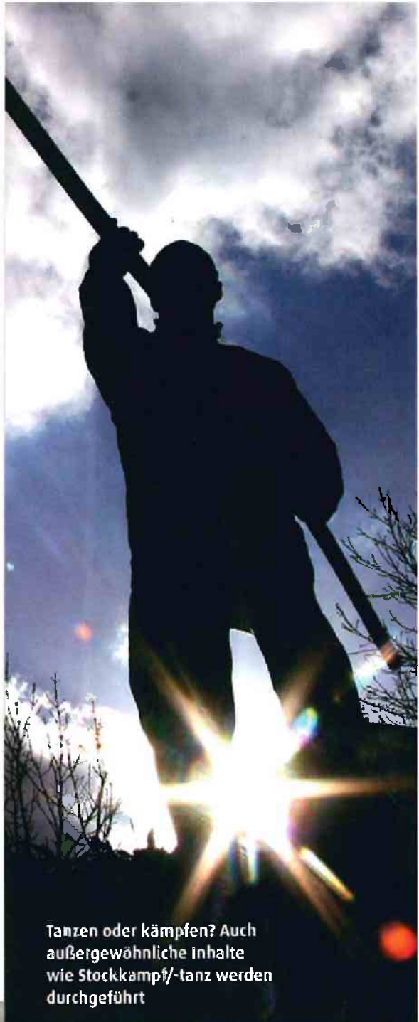
Tanzen oder kämpfen? Auch außergewöhnliche Inhalte wie Stockkampf/-tanz werden durchgeführt

„Wer ist das? Sie kennen den Menschen. Hier ein Auszug aus seiner Biographie: männlich, verheiratet, ohne Schulabschluss, Arbeit als Fensterrahmenverkäufer, Aushilfssänger, Alleinunterhalter.“ Im Seminarraum, grübelnde Gesichter unter den Teilnehmern. Könnte das nicht ...? Nein. Oder doch? Schließlich traut sich jemand: „Kann es sein, dass ich ihn in diesem Jahr auf Schalke gesehen habe?“ Antwort des Referenten: „Ziemlich warm.“ Teilnehmer: „Okay. Dann sag ich's: Robbie Williams!“ Referent: „Richtig! Hier noch ein paar Infos zur Biografie des Künstlers: Robbie Williams (geb. 1974) leidet oder litt unter Depressionen, Borderline-Persönlichkeitsstörung und ist einer der erfolgreichsten europäischen Entertainer der letzten Jahre.“